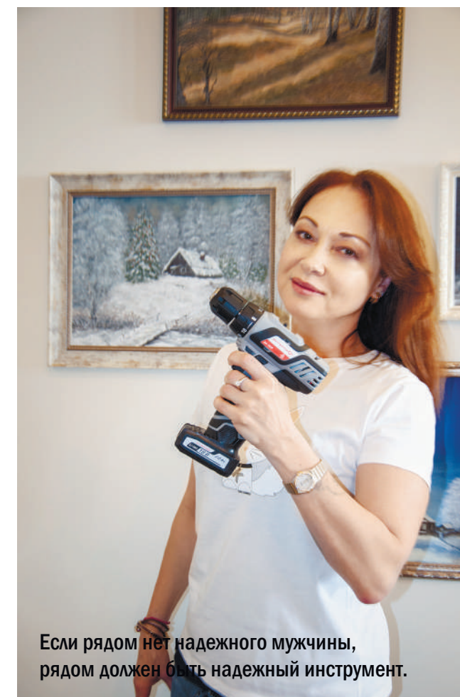
Если рядом нет надежного мужчины, рядом должен быть надежный инструмент.

А Сирия да... Первый раз это был просто безбашенный поступок. В тот момент я и не боялась. Хотя мои родители в Москве просто поседели. Но вот когда мы с артистами оказались под артобстрелом, когда возникло ощущение нереальности