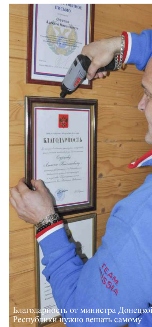
Благодарность от министра Донецкой Республики нужно вешать самому